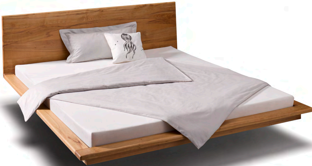
Bett MATIS in Kernbuche, mit Holzkopfteil