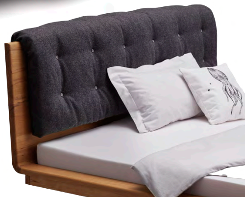
Variante mit Überwurf